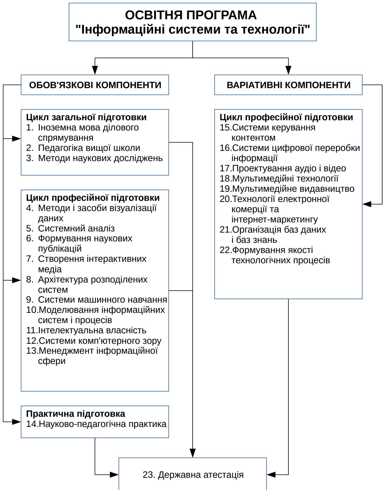
Рис. 1. Схема компонентів освітньо-професійної програми «Інформаційні системи та технології»